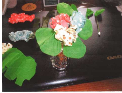
リボンで小花作り